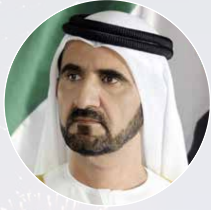
صاحب السمو الشيخ محمد بن راشد آل مكتوم نائب رئيس الدولة رئيس مجلس الوزراء حاكم دبي