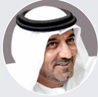
سمو الشيخ أحمد بن سعيد آل مكتوم رئيس مجلس الإدارة