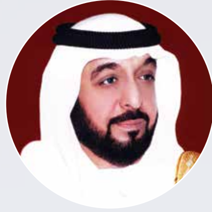
صاحب السمو الشيخ خليفة بن زايد آل نهيان رئيس دولة الإمارات العربية المتحدة